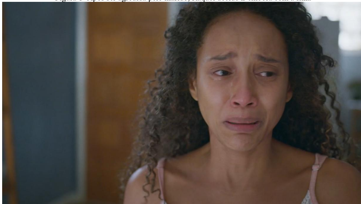
Figura 1- Após ser agredida pelo marido, Raquel decide ir embora com a filha