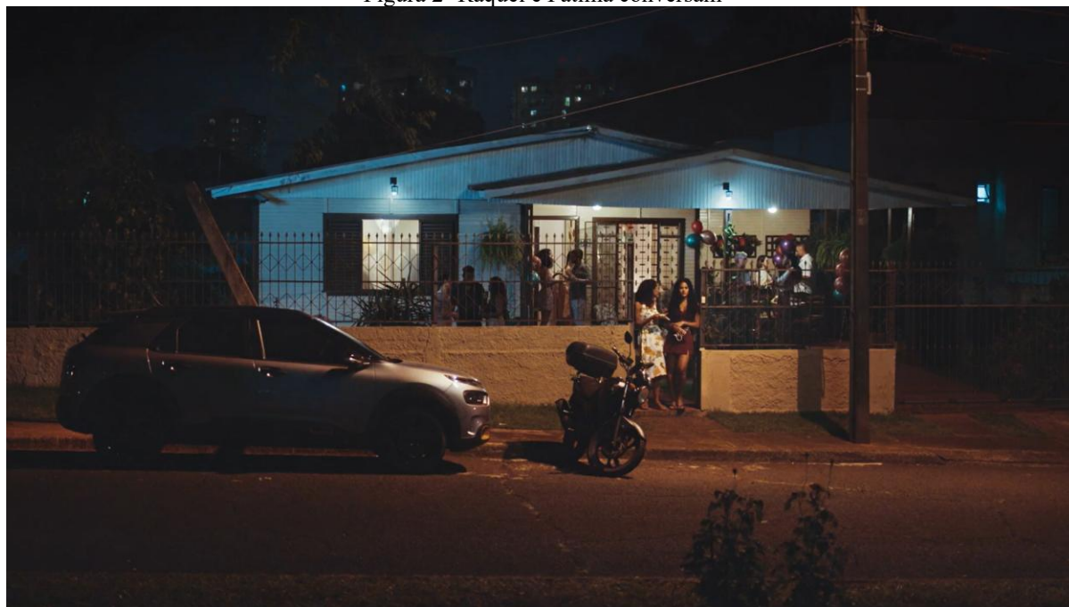
Figura 2- Raquel e Fátima conversam