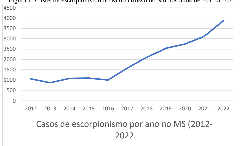
Figura 1. Casos de escorpionismo no Mato Grosso do Sul nos anos de 2012 à 2022.