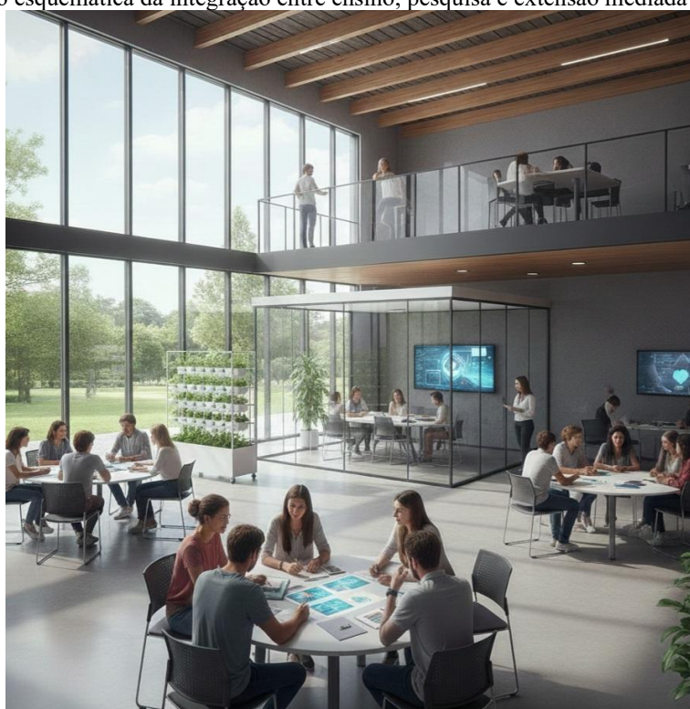
Figura 1 – Representação esquemática da integração entre ensino, pesquisa e extensão mediada pelas metodologias ativas

As políticas públicas educacionais reforçam essa perspectiva ao incentivar a inovação pedagógica e a ampliação das atividades extensionistas. O Plano Nacional de Educação (PNE) 2014–2024 estabelece metas voltadas à qualificação do ensino superior, à produção científica e à inserção social das universidades, destacando a necessidade de práticas formativas alinhadas às demandas da sociedade contemporânea (Brasil, 2014). Complementarmente, a Resolução CNE/CES nº 7/2018 normatiza a extensão universitária, determinando sua integração obrigatória aos currículos de graduação como estratégia de formação cidadã e transformação social (Brasil, 2018).