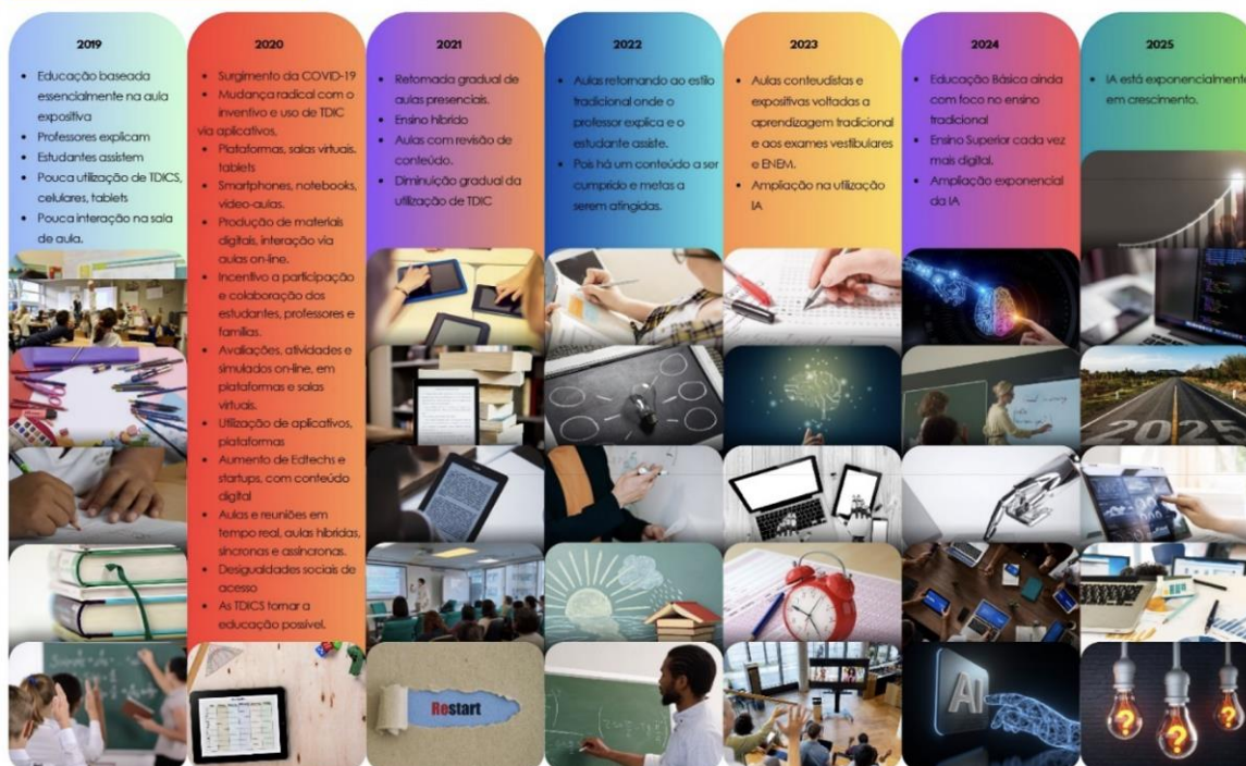
Figura 2: A Revolução Digital entre os anos 2019 e 2025